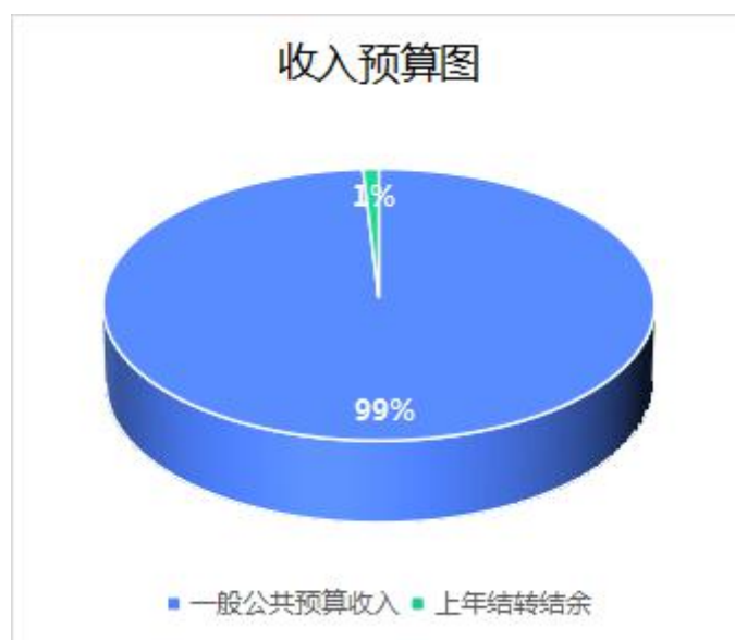
图 1. 收入预算图

本年事业收入 0 万元，占 0%； 本年事业单位经营收入 0 万元，占 0%； 本年上级补助收入 0 万元，占 0%； 本年附属单位上缴收入 0 万元，占 0%； 本年其他收入 0 万元，占 0%； 上年结转结余的一般公共预算收入 12.71 万元，占 0.97%； 上年结转结余的政府性基金预算收入 0 万元，占 0%； 上年结转结余的国有资本经营预算收入 0 万元，占 0%； 上年结转结余的财政专户管理资金 0 万元，占 0%； 上年结转结余的单位资金 0 万元，占 0%；